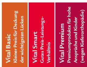
VVG – ambulante Zusatzversicherung

Sie als Kunde oder Kundin können im Rahmen des Sorglos-Paketes aus ergänzenden Zusatzversicherungen auswählen.