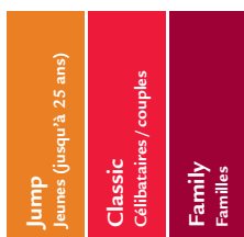
Assurance complémentaire ambulatoire selon la LCA