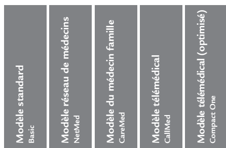
Assurance obligatoire des soins selon la LAMal