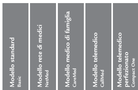
LAMal – assicurazione base obbligatoria