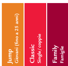
LCA – assicurazione complementare ambulatoriale